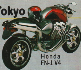
Honda FN-1 V4